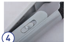
④ ストレスのない使用感

使用温度までの立ち上がりが早く、電源を入れてから約34秒で180℃に到達。温度メモリー機能を搭載し、最後に設定した温度を記憶することで温度調整の手間も軽減。