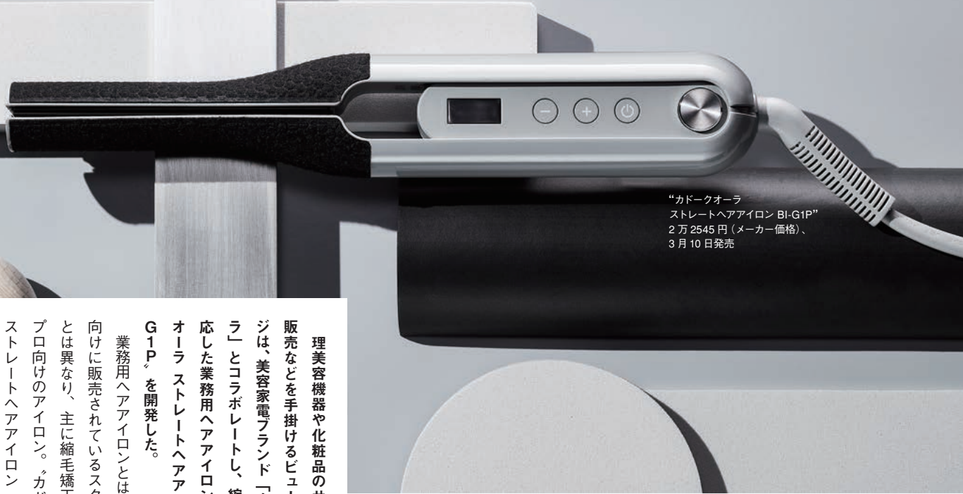
“カドークオーラ ストレートヘアアイロン BI-G1P” 2万2545円(メーカー価格)、 3月10日発売

理美容機器や化粧品のカラコン向け卸販売などを手掛けるビューティガレージは、美容家電ブランド「カドークオーラ」とコラボレートし、縮毛矯正に対応した業務用ヘアアイロン「カドークオーラ ストレートヘアアイロン BI-G1P」を開発した。 業務用ヘアアイロンとは、一般消費者向けに販売されているスタイリング用とは異なり、主に縮毛矯正に対応したプロ向けのアイロン。カドークオーラ ストレートヘアアイロン BI-G1Pは、機能性の高さと、シンプルかつスタイリッシュなデザインが特徴だ。