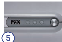
⑤ 温度調整の手間を軽減

プレートを覆う部分の幅を極限まで薄くし、四隅の角をなくしたことで、根元のキワまでアプローチできる。前髪や毛先のカールなどのスタイリングにも使用できる。