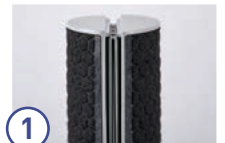
① “根元攻め”のしやすさ

熱伝導率が高く上下のかみ合わせが良いプレート。片側にサスペンション構造を施すことで、わずかな力でもプレートがしなり、思い通りのテンション調整が可能に。